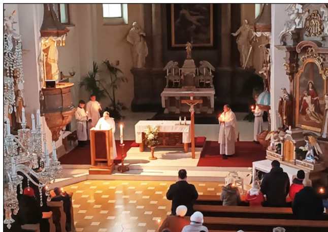
Velikonoční vigilie na Bílou sobotu