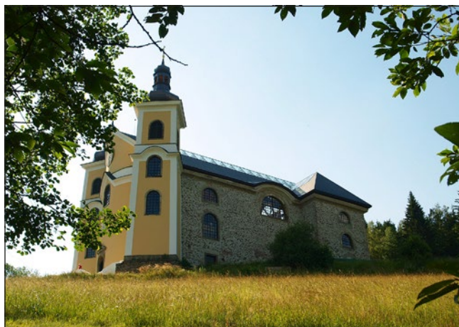
Kostel v Neratově

Ostatně celý Neratov je již od druhé poloviny 17. století významným poutním místem. Tehdy na tom měla svou zásluhu milostná soška Panny Marie a pramen, který u kostela vyvěrá. Pů-