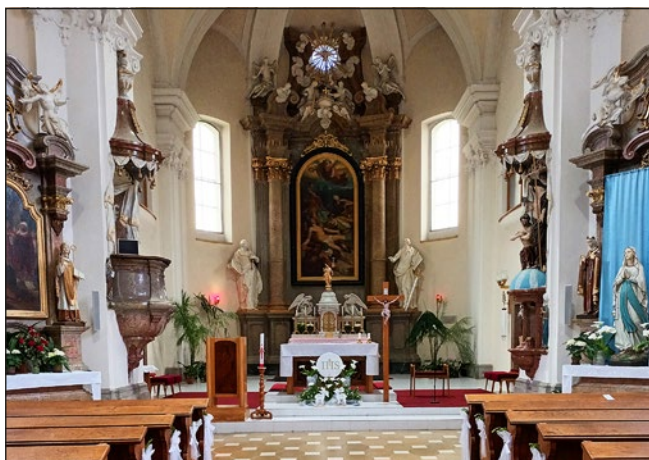
Výzdoba kostela na 1. svatě přijímání