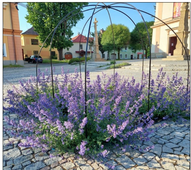
Letní pastva pro včely