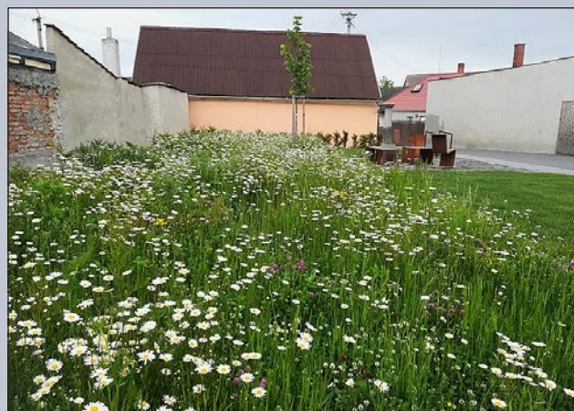
Květinová louka v Drahotuších u stromu republiky