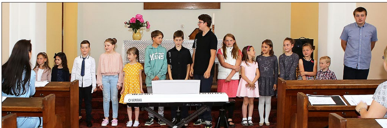
Noc kostelů v Husově sboru

A pokud nejste zrovna v karanténě nebo v nějakém riziku, nebojte se přijít na mši svatou. Koronavirus nás sice trochu omezil, ale v mnohém nám nastavil zrcadlo. Jsme rádi, že skoro všichni farníci jsou zpět a pospolu při slavení bohoslužeb.