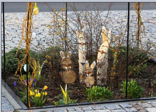
Fotovzpomínka na letošní Velikonoce

V průběhu akce bylo možno na letišti vidět i aktivity Modelářského klubu Aeroklubu Hranice, jehož první letošní akcí bylo ukázkového létání obřích modelů. Modelářská plocha na letišti byla využívána dětmi, členy modelářského kroužku pro první lety jejich vlastnoručně vyrobených modelů letadel.